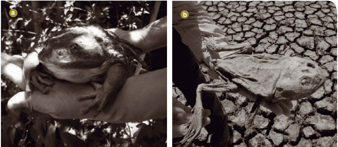
Figura 2: a) Hembra reproductora de Calyptocephalella gayi procedente de la comuna de Navidad, Región del Libertador Bernardo O'Higgins, peso vivo oviplena 1200 gramos, longitud rostro-cloaca 24 cm., b) se muestra un ejemplar muerto de la misma especie encontrado en el sector este de la laguna Matanzas en la Reserva Nacional El Yali, identificado como hembra y con longitud rostro-cloaca de 22 cm..

(fines 2013-comienzos de 2014) sólo se registró la mitad (N= 89). En la figura 3 se muestra un grupo de 25 individuos muertos encontrados durante enero y febrero de 2014. Destaca que el mayor número de ranas muertas se encontraron en los meses de enero y febrero tanto para el 2013 como 2014, asociándose estos hallazgos precisamente a los meses con las más altas temperaturas y escasas de agua dulce del año.