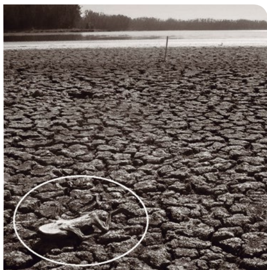
Figura 4: Drástica disminución de los niveles de agua que afecta actualmente a la laguna Matanzas. Se observa un cadáver de rana grande chilena ( Calyptocephalella gayi ) en el álveo de la laguna.