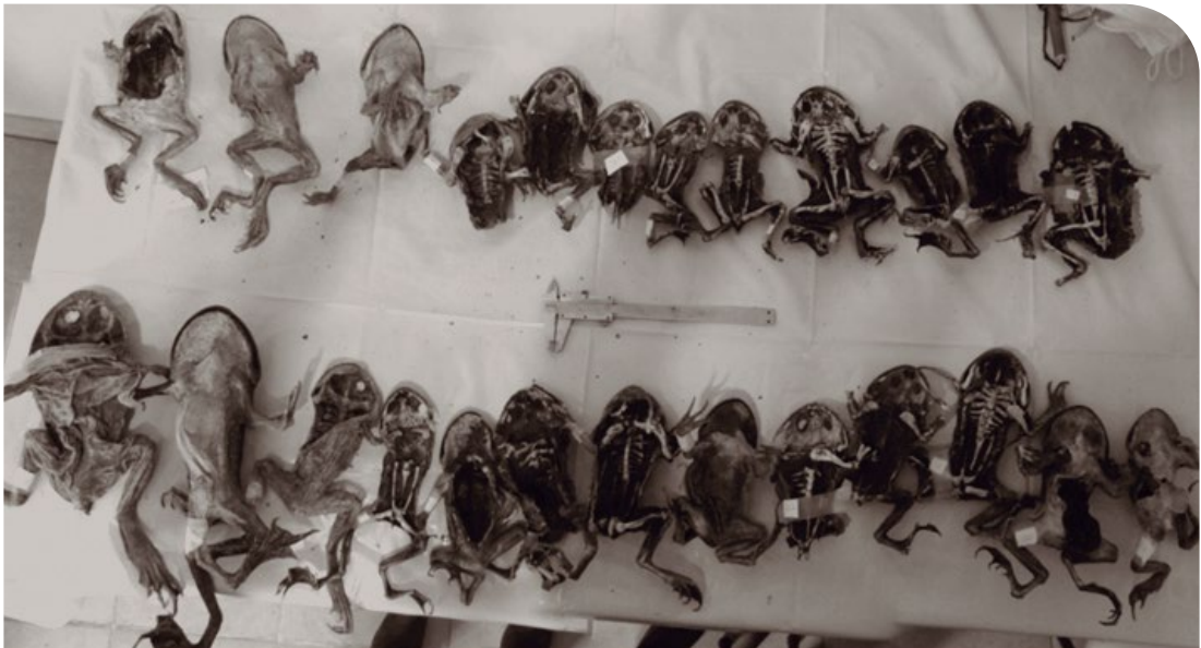
Figura 3: Se muestra un grupo de 25 cadáveres de rana grande chilena ( Calyptocephalella gayi ) encontrados durante enero y febrero de 2014 en el sector este de la laguna Matanzas en la Reserva Nacional El Yali.