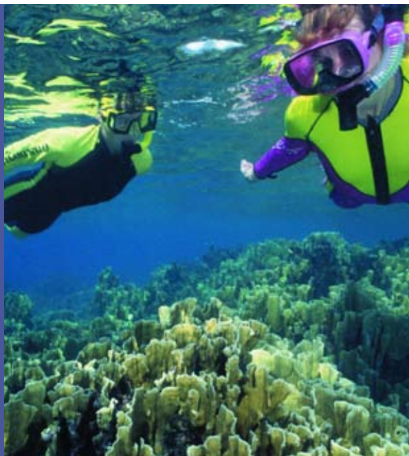
Submarinismo en Bonaire, TUI Nederland

Los arrecifes de coral ilustran la compleja y a veces adversa relación entre el turismo y los humedales. Los países que tienen arrecifes de coral atraen a millones de submarinistas cada año. Globalmente, se estima que el turismo proporciona casi 10 mil millones de US$ en beneficios netos anuales, casi dos veces más que la pesca, y mucho más que los gastos de los turistas. Sin embargo, el deterioro de los arrecifes, con frecuencia causado por el aumento del turismo, amenaza los ingresos derivados del turismo en los arrecifes mismos. El daño directo que causan los turistas y los impactos indirectos que causan las construcciones sin regulación y la operación irresponsable de los establecimientos de turismo son una amenaza a los arrecifes coralinos y a los ingresos que estos proporcionan a la población local. 6