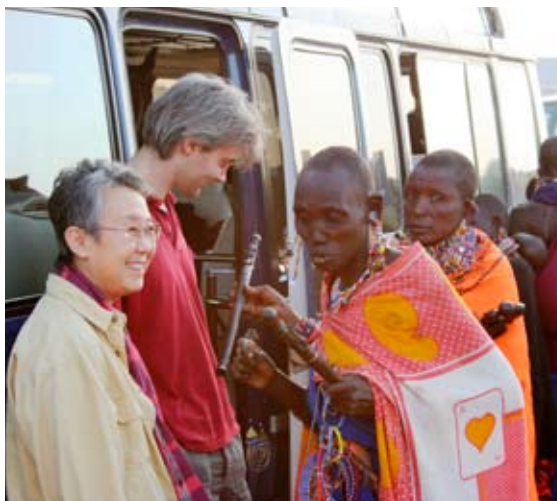
Maasai vendiendo artesanías a turistas - Kenya, Marcel Silvius-WI

El turismo a favor de los pobres es un turismo que genera beneficios netos para los pobres. Los beneficios pueden ser económicos y ambientales así como sociales y culturales. No se debe