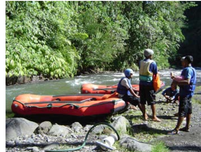
Rafting entre campos de arroz

sus gastos básicos de vivienda o alimentación). Las donaciones son, en ciertos casos, bienes y servicios donados para apoyar la conservación de los humedales.