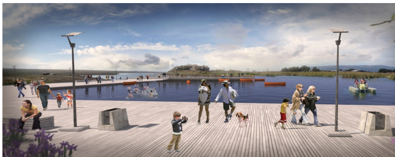
IMAGEN PROYECTO DETONANTE

Para el presente proyecto, ubicado al inicio de la vía desde el área urbana consolidada, se contemplan obras de nivelación del terreno correspondiente a la vialidad peatonal y vehicular en las áreas que no están ejecutadas y el aterrazamiento de las áreas destinadas a miradores, estacionamientos de bicicletas y estaciones de recreación equivalentes a 5.240 m 2 , lo que implica movimientos de tierra en un total aproximado de 3668 m 3 . Se considera ejecutar una acera peatonal de borde con pavimentos para el desplazamiento de peatones y eventual tráfico vehicular sólo de emergencia y una ciclovía. En relación al manejo de los espacios exteriores, se contempla la colocación de iluminación cada 15 metros y mobiliario urbano adecuado de acuerdo a tipologías definidas en el Plan Maestro de Áreas Verdes de la Comuna. En general para el tramo 1 correspondiente a 1163 metros lineales de vía peatonal, se contemplan 2.746,12 m 2 de acera, 2308,44 m 2 de ciclovía y 77 luminarias.